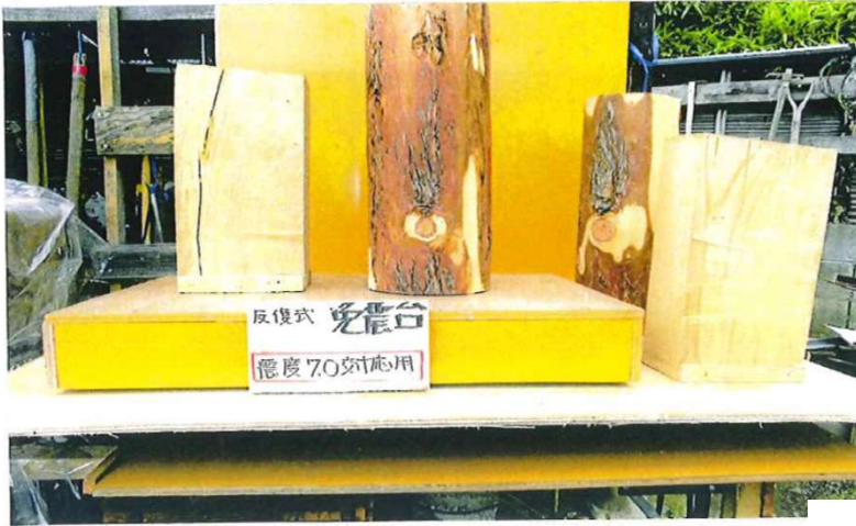
改良版の免震台 震度7.0に対応 ※本実用新案構造適用品