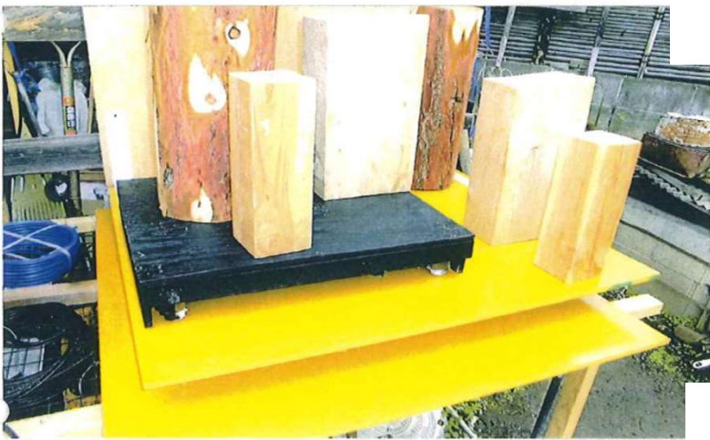
震度6.0強まで 転倒のなかった免震台 ※従来考案品