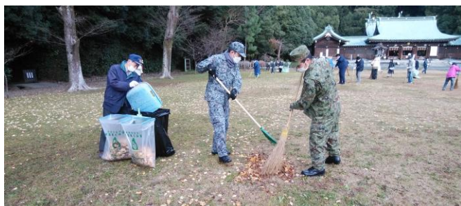
アダプターを取り付け大きな各袋で分別ゴミ作業