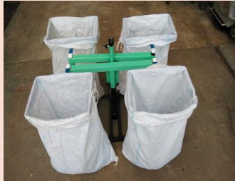
組立バリエーション豊富