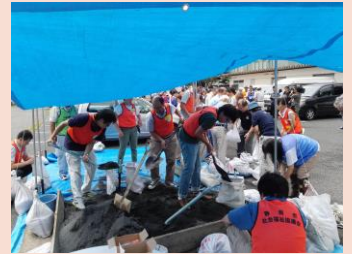
土嚢作りと土嚢リレー

近年水防演習・災害現場など、様々な作業現場で若者だけでなく、高齢者や女性の活躍が見受けられます。