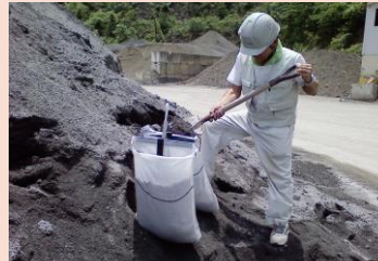
のりめん 法面使用