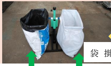
堆肥ビニール袋・土嚢袋