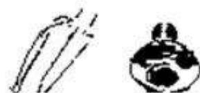
ナット座金ボルトの回転同期品