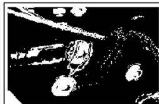
ナット座金ボルトの回転同期品