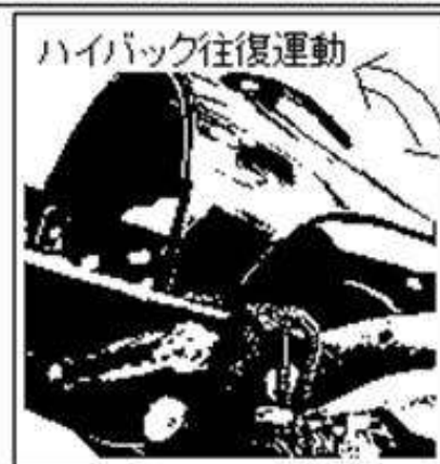
ハイバック往復運動