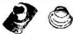
比較品のナット座金