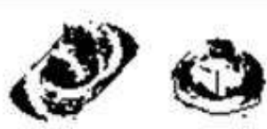
ナット座金の回転同期品