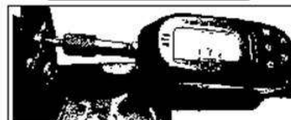
トルク測定器LeoLeeデジタル トルクレンチ0.3-6Nm