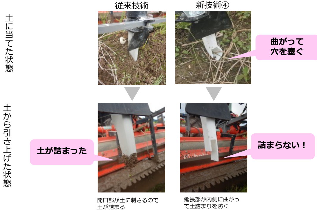
図1 播種ノズルが土に当たった状態と土から引き上げた状態 左：従来技術、右：新技術④

農業用機械で肥料や種を落とすノズルは誤って土に刺すと土が詰まって肥料や種が落ちなくなって作業に支障が生じました。このノズルは誤って土に刺しても土が詰まりにくく、正確な作業が行えます。素材の堅さや形状にバリエーションがあります（図2）。