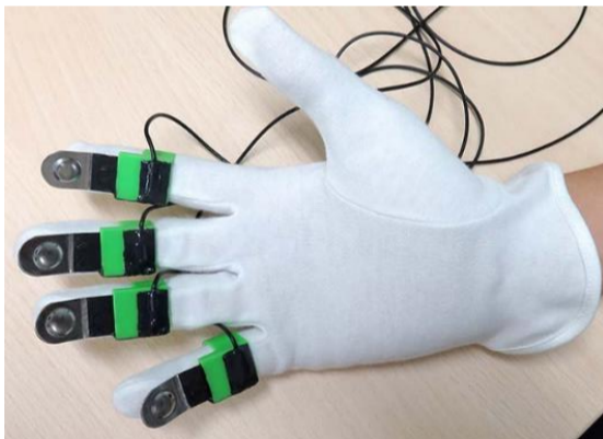
評価用デバイス(人工爪)のイメージ