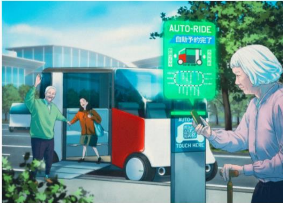
誰でも簡単に予約できるスマート・モビリティサービス「EasyMobility」

カンタンサービスの技術をモビリティ分野に応用すれば、全国のスポットに付与されたQRコードにユーザーがスマホをかざすだけで誰もが簡単に送迎の自動運転車やシェア自転車の利用ができるモビリティサービス「 Easy Mobility 」が提供できるだろう。