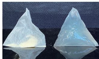
乾燥状態1g → 給水後100g