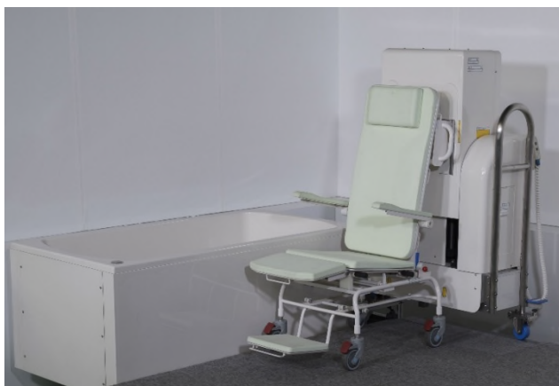
商品化例:座浴式入浴装置「らくら」