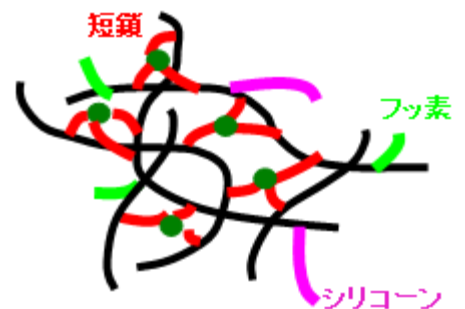
本技術の樹脂構造のイメージ

本技術では、プレポリマー中の短側鎖ヒドロキシル基に対する長側鎖ヒドロキシル基の含有比を小さくし、プレポリマーの主鎖同士を密に架橋しています。さらにプレポリマーはSi側鎖、F側鎖を有します。これにより、水接触角を従来の70°程度から102°程度までに向上させることができます。さらに、耐熱性を従来の100°C程度から240°C程度にまで向上させることができます。