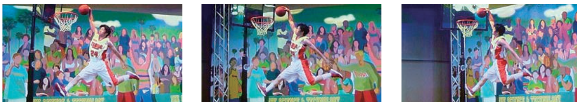
図 多視点映像の例

多視点映像を生成する際に、各カメラの光軸が被写体の実在する位置（注視点）で交わっていなかったり、レンズの画角が揃っていなかったりすると、カメラ映像の切り替え時に映像の「がたつき」が生じます。そこで、画像処理によって、このがたつきを補正しています。注視点は、実空間中の点としてオペレーターがカメラ映像上で指定します。指定した注視点が、画面中心となるように射影変換処理を施すことで、各カメラの注視点を一致させます。さらに、各カメラから注視点までの距離の違いによる被写体の像の大きさをそろえます。3 秒程度のシーンであれば 5 秒程度で処理することができます。